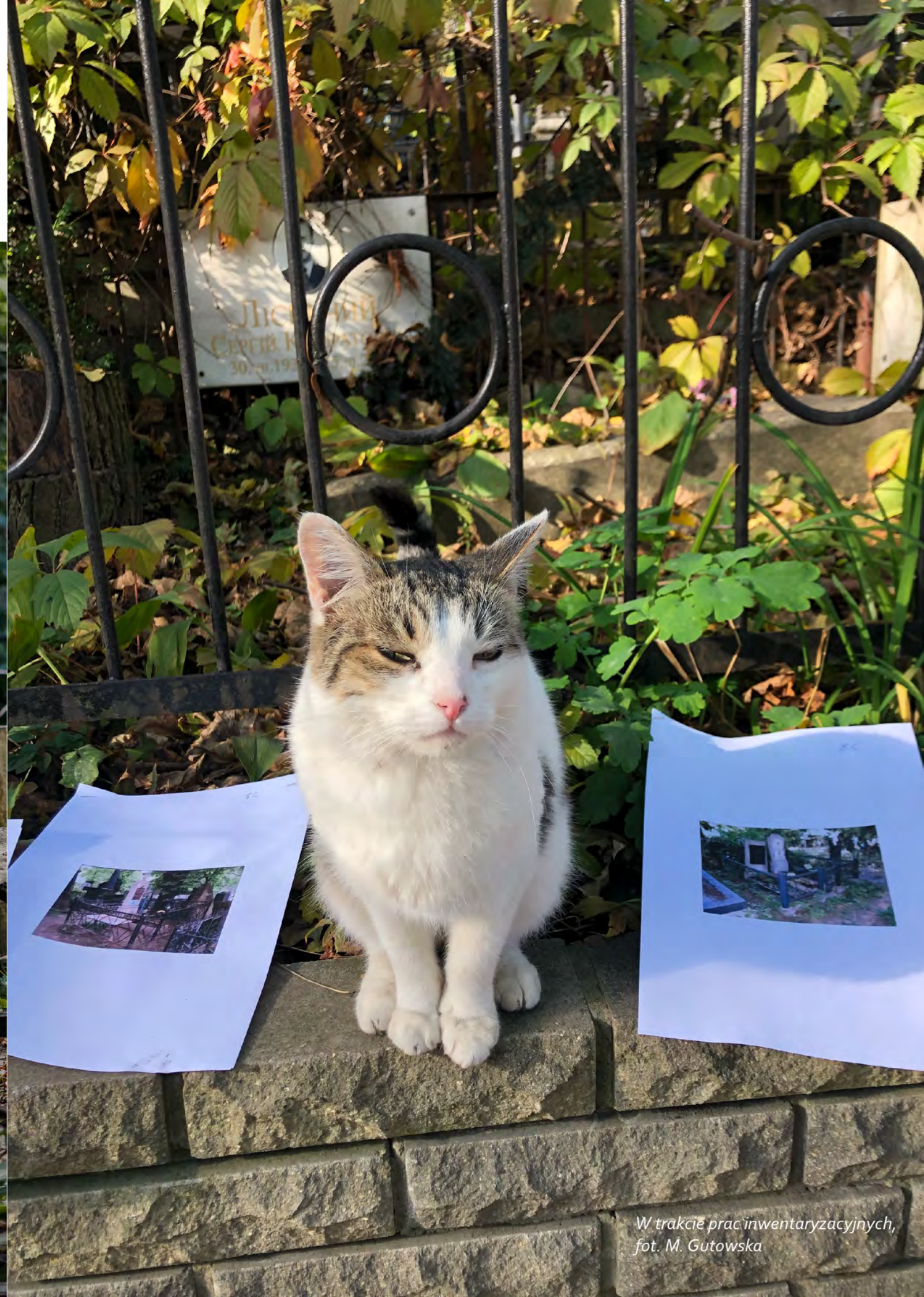
W trakcie prac inwentaryzacyjnych