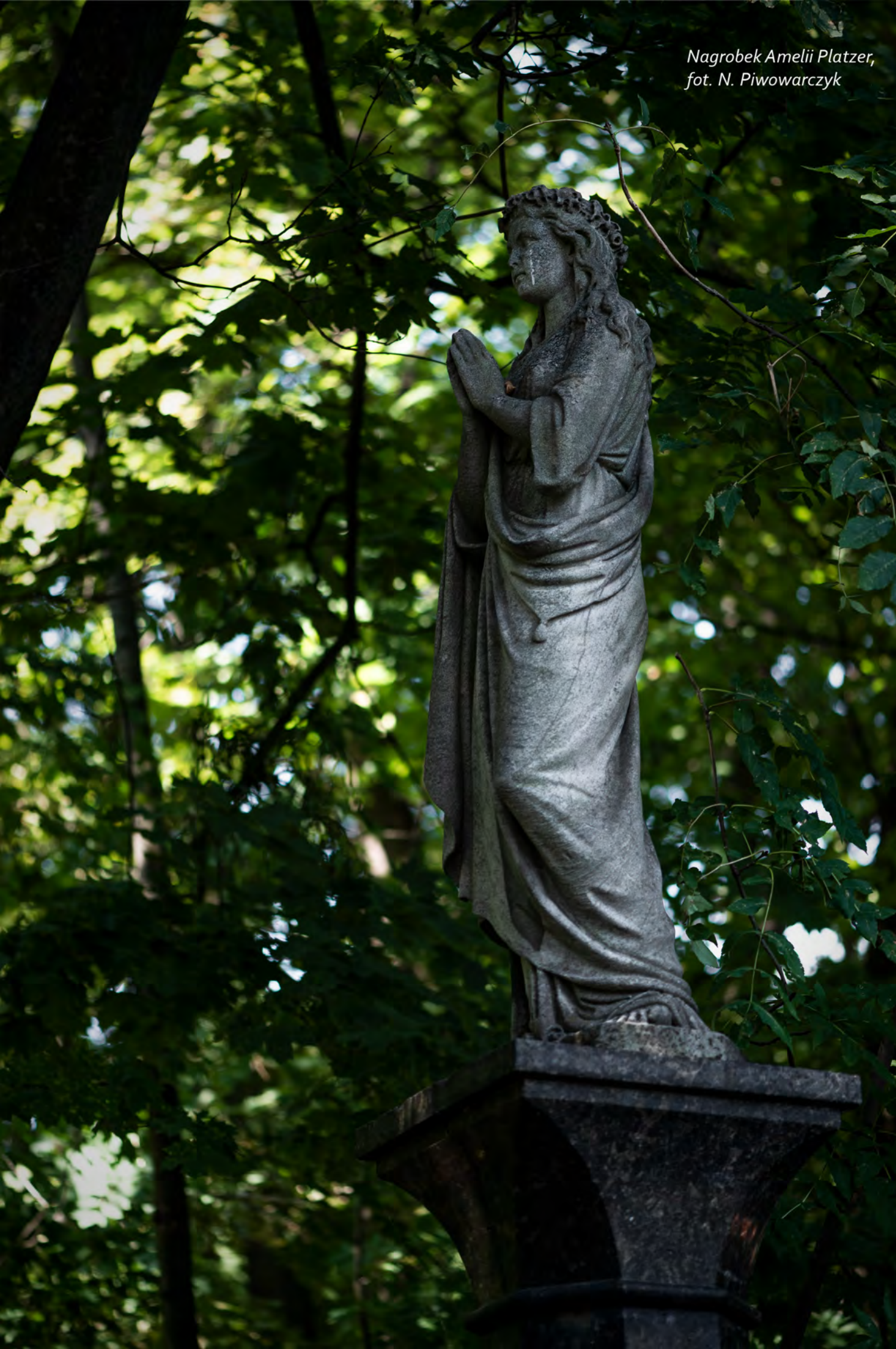
Nagrobek Amelii Platzer, fot. N. Piwowarczyk