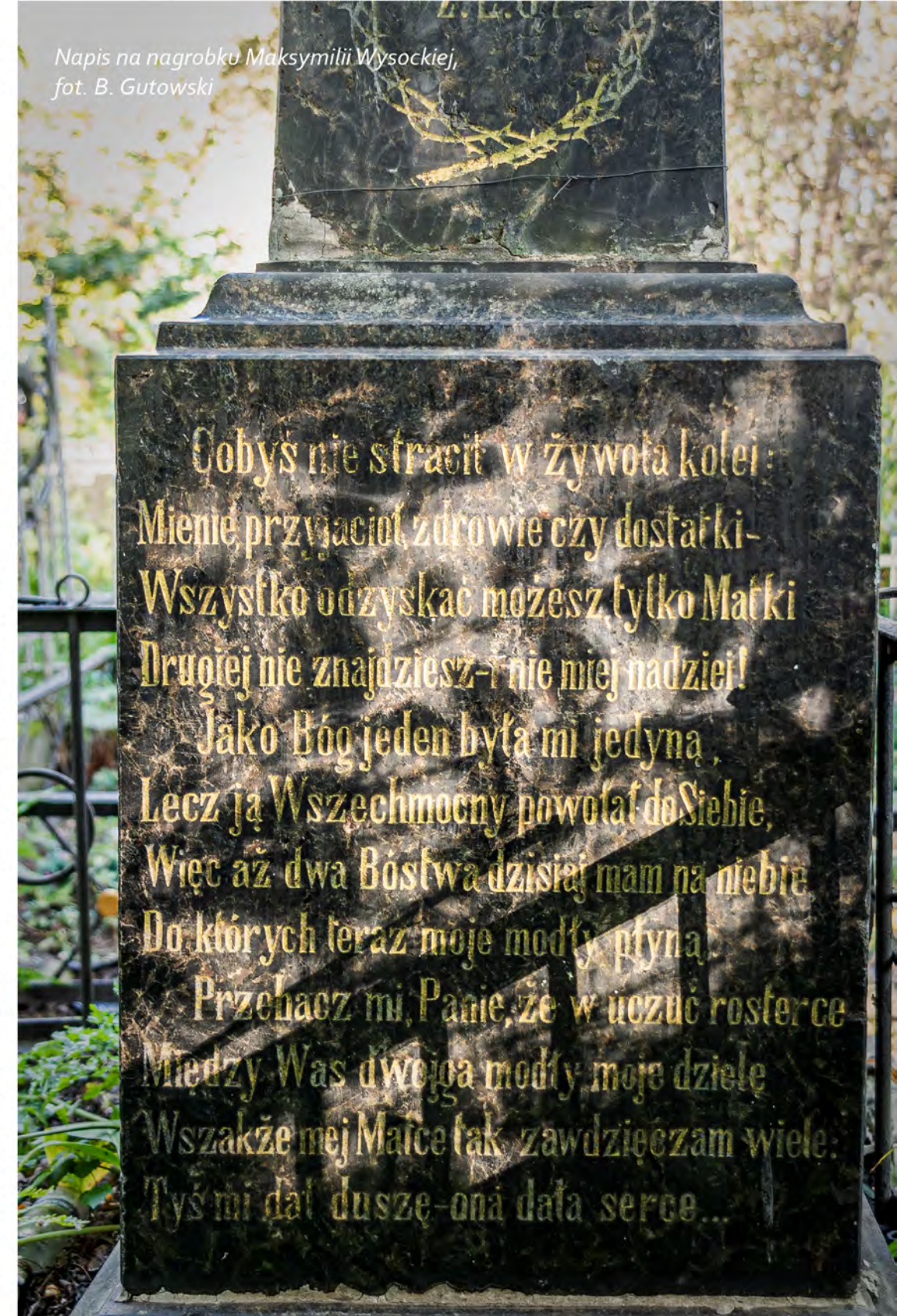
Napis na nagrobku Maksymilii Wysockiej