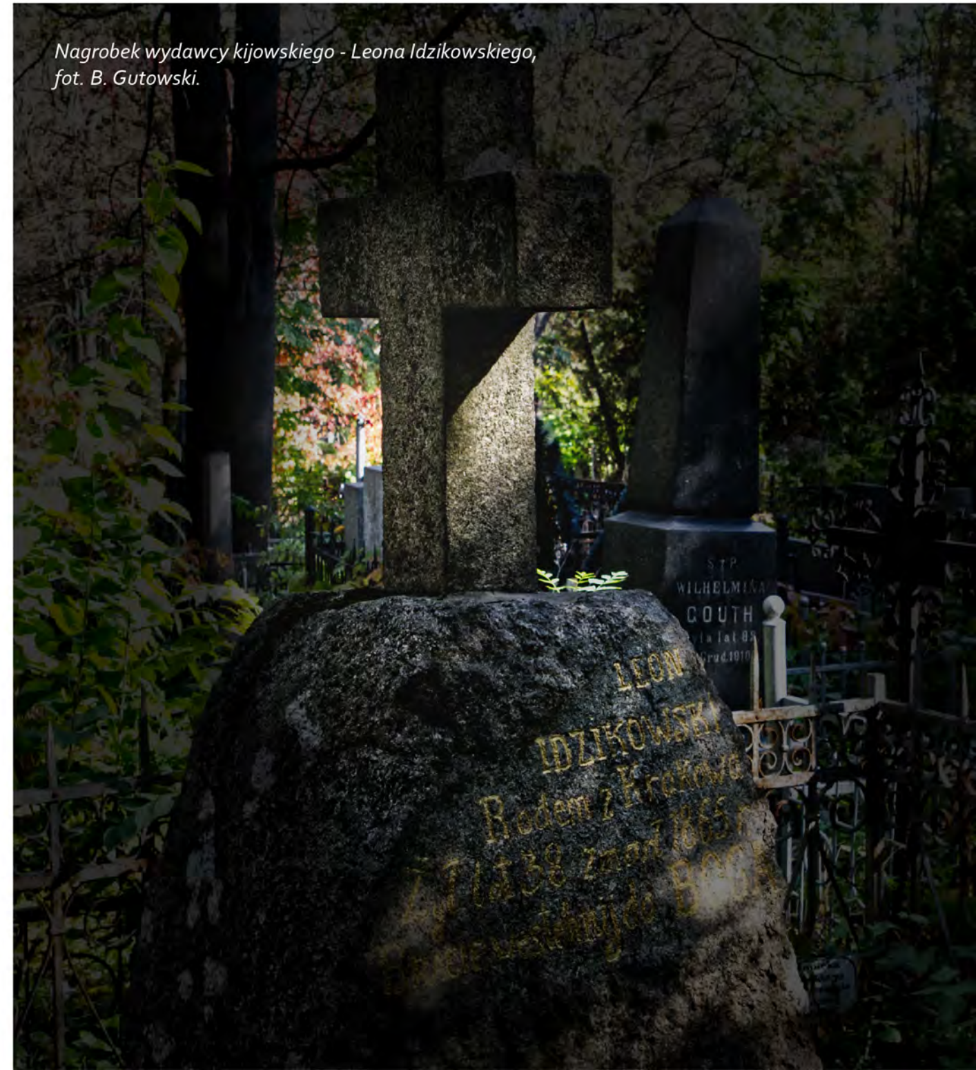
Nagrobek wydawcy kijowskiego - Leona Idzikowskiego, fot. B. Gutowski.