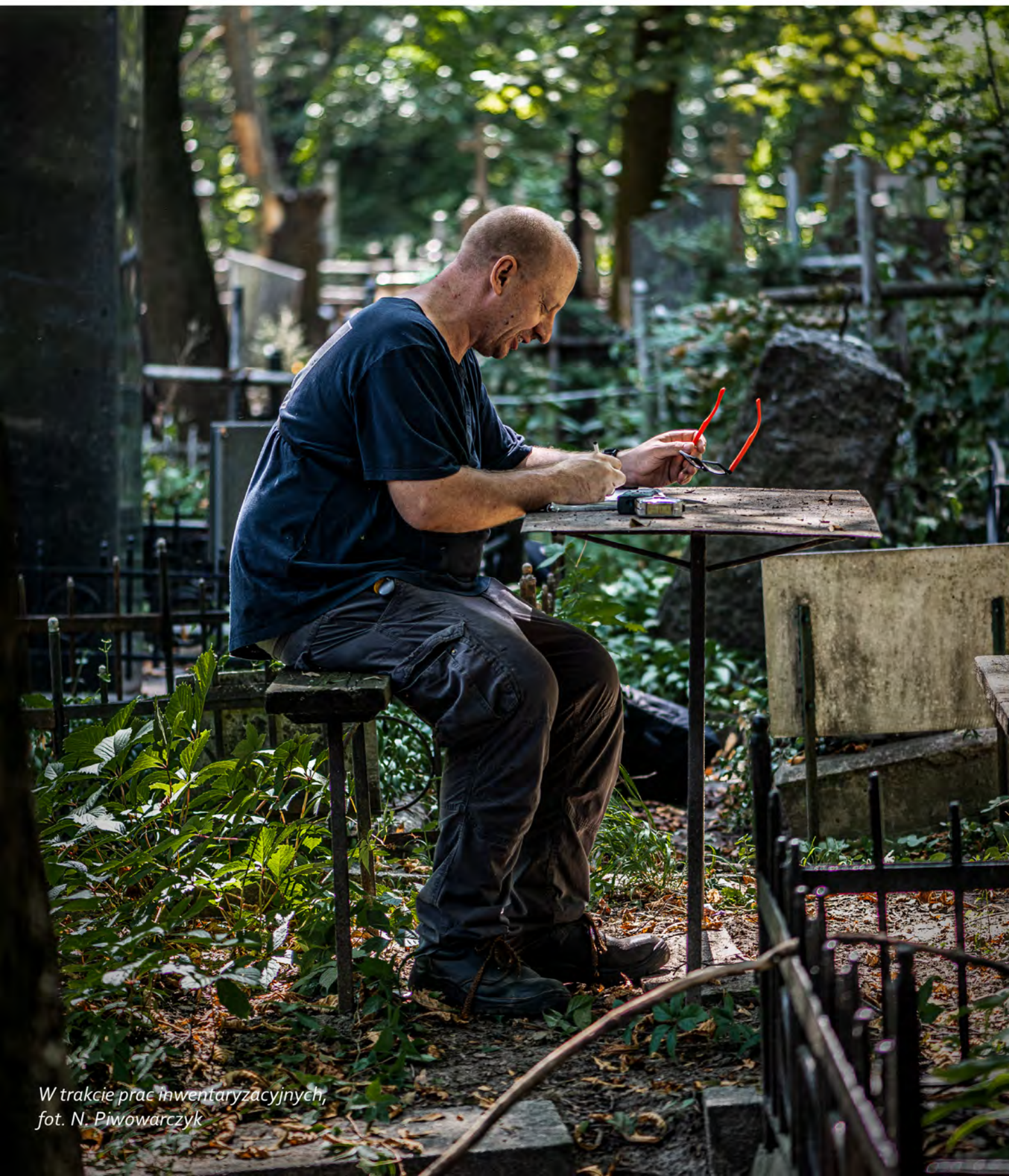
W trakcie prac inwentaryzacyjnych