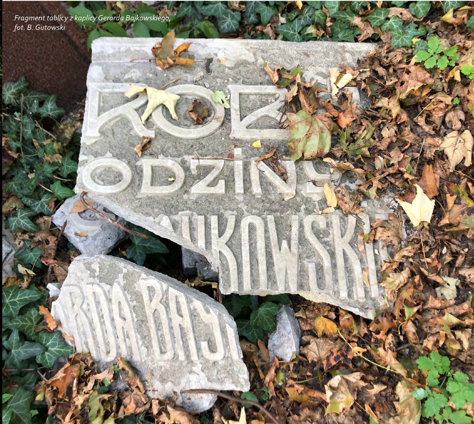
Fragment tablicy z kaplicy Gerarda Bajkowskiego

Opiekę sprawują też inne polskie organizacje – Międzynarodowe Stowarzyszenie Przedsiębiorców Polskich na Ukrainie czy Związek Polaków na Ukrainie. W akcję porządkowania włączają się dyplomaci i pracownicy ambasady, konsulatu i Instytutu Polskiego, przede wszystkim zaś mieszkanki i mieszkańcy Kijowa. Czasem przyjeżdżają do pomocy również grupy z Polski.