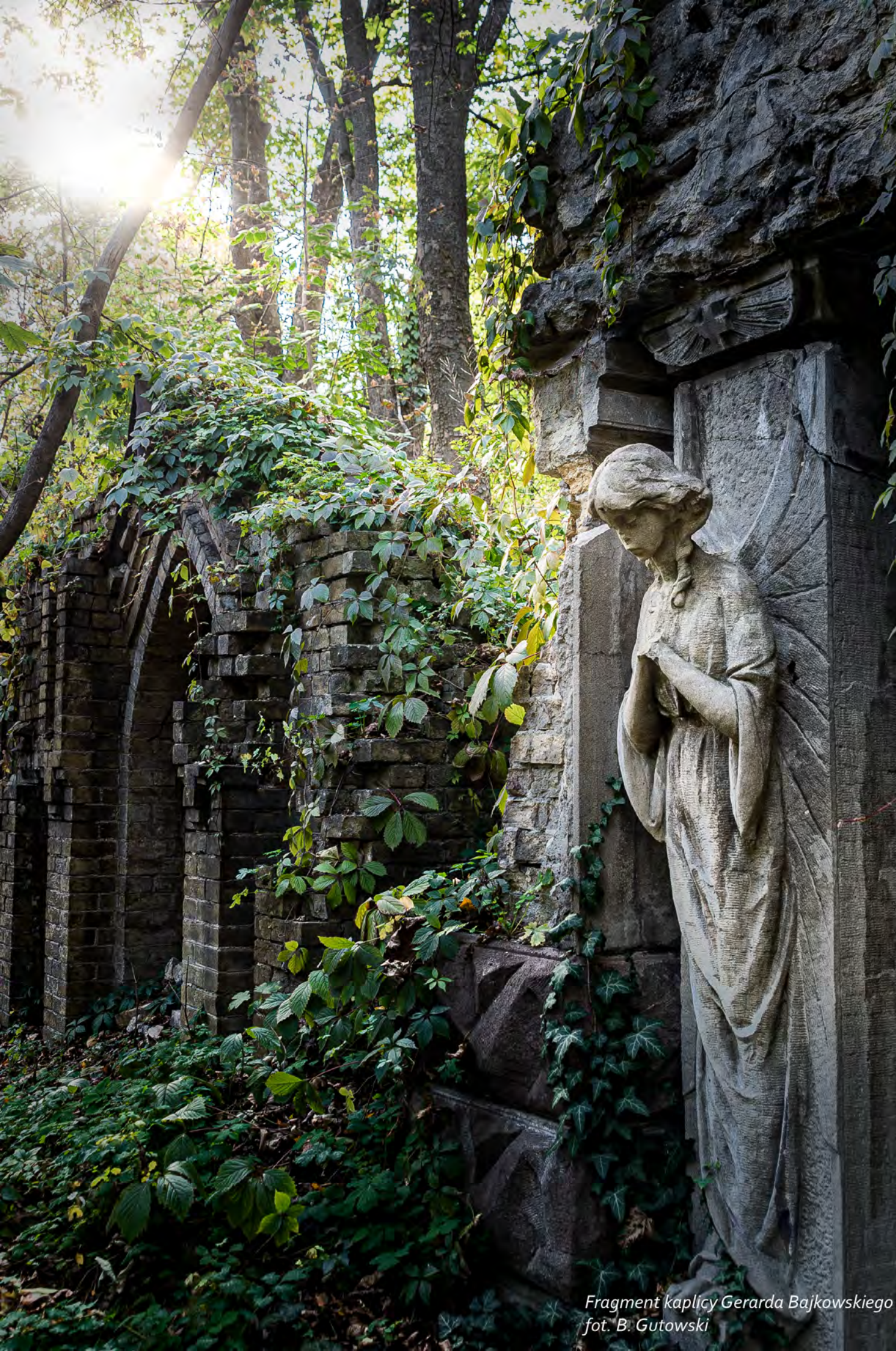
Fragment kaplicy Gerarda Bajkowskiego

W 1812 roku w Kijowie mieszkali ponad 4 tysiące Polaków. Na początku XX wieku było ich około 17 tysięcy. Stanowili mniej więcej siedmioprocentową mniejszość o dużym potencjale ekonomicznym i wpływie na życie miasta. Niektórzy zdobyli wysoką pozycję, jak Józef Zawadzki, założyciel miejskiej giełdy i prezydent w latach 1860–1863. W Kijowie swoje przedstawicielstwa miały znaczące polskie przedsiębiorstwa.