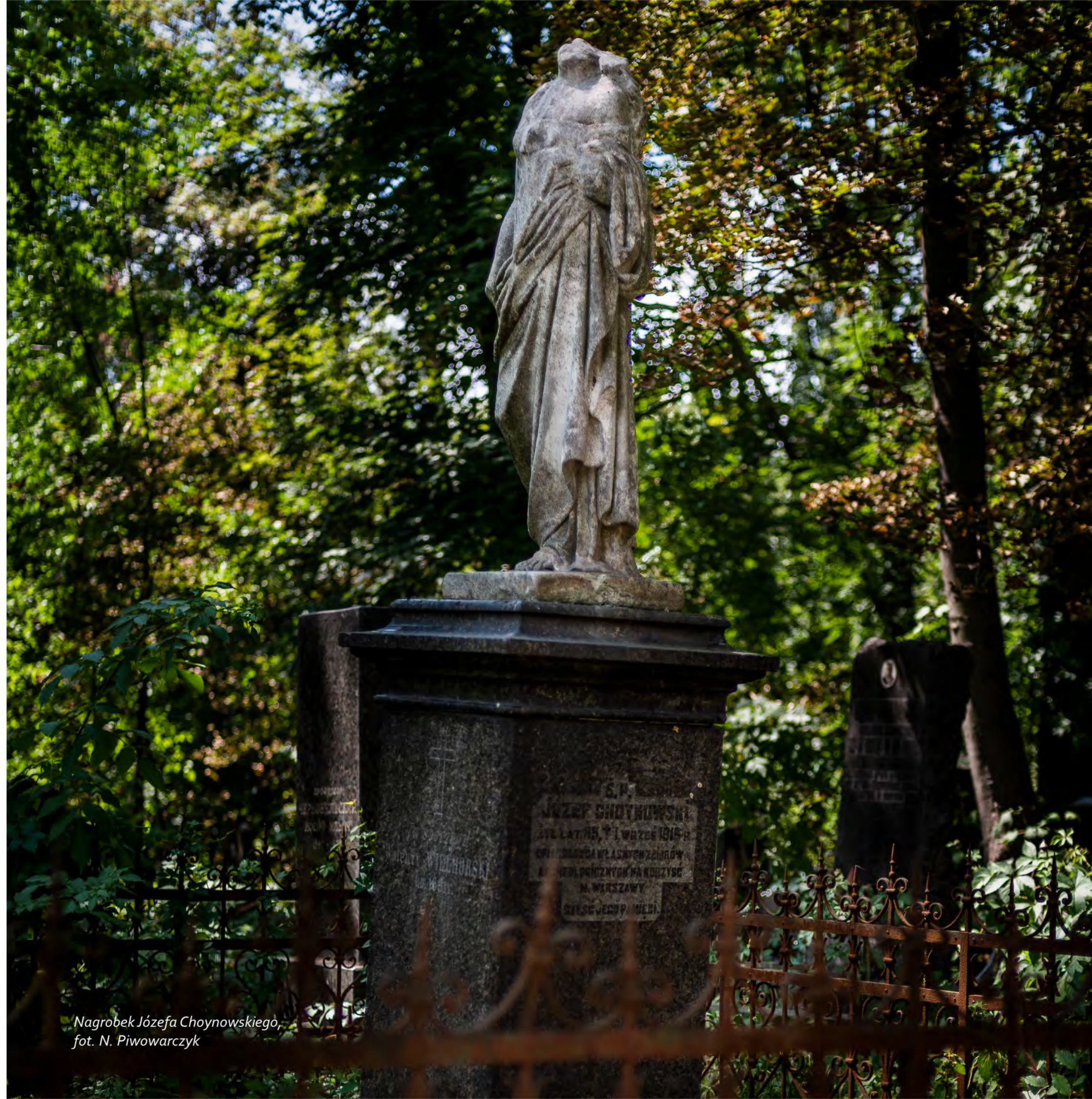
Nagrobek Józefa Choynowskiego