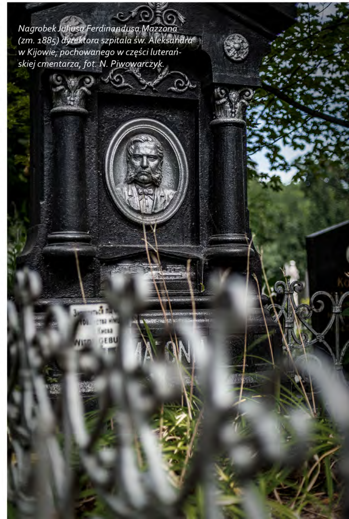
Nagrobek Juliusa Ferdinandusa Mazzoni (zm. 1885) dyrektora szpitala św. Aleksandra w Kijowie, pochowanego w części luteran- skiej cmentarza, fot. N. Piwowarczyk.

W Kijowie działały polskie organizacje, jak np. Towarzystwo Patriotyczne, Polskie Towarzystwo Gimnastyczne „Sokół”, działał polski teatr, od roku 1906 zaczęła ukazywać się polskojęzyczna prasa, m.in. „Dziennik Kijowski” czy „Kłosa Ukraińskie”.