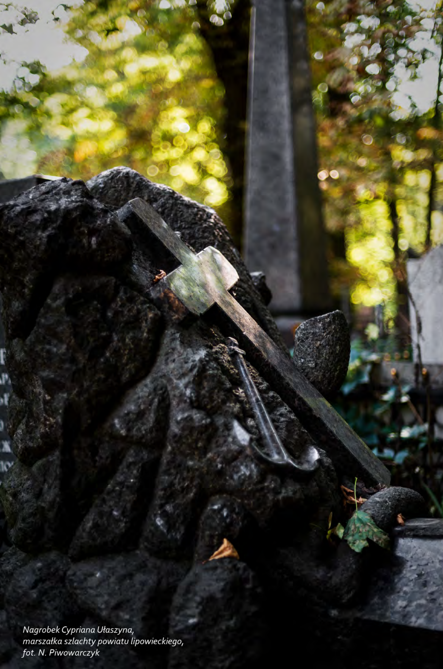
Nagrobek Cypriana Ułaszyna, marszałka szlachty powiatu lipowieckiego, fot. N. Piwowarczyk

Na cmentarzu zachowało się kilkaset nagrobków z napisami w języku polskim.